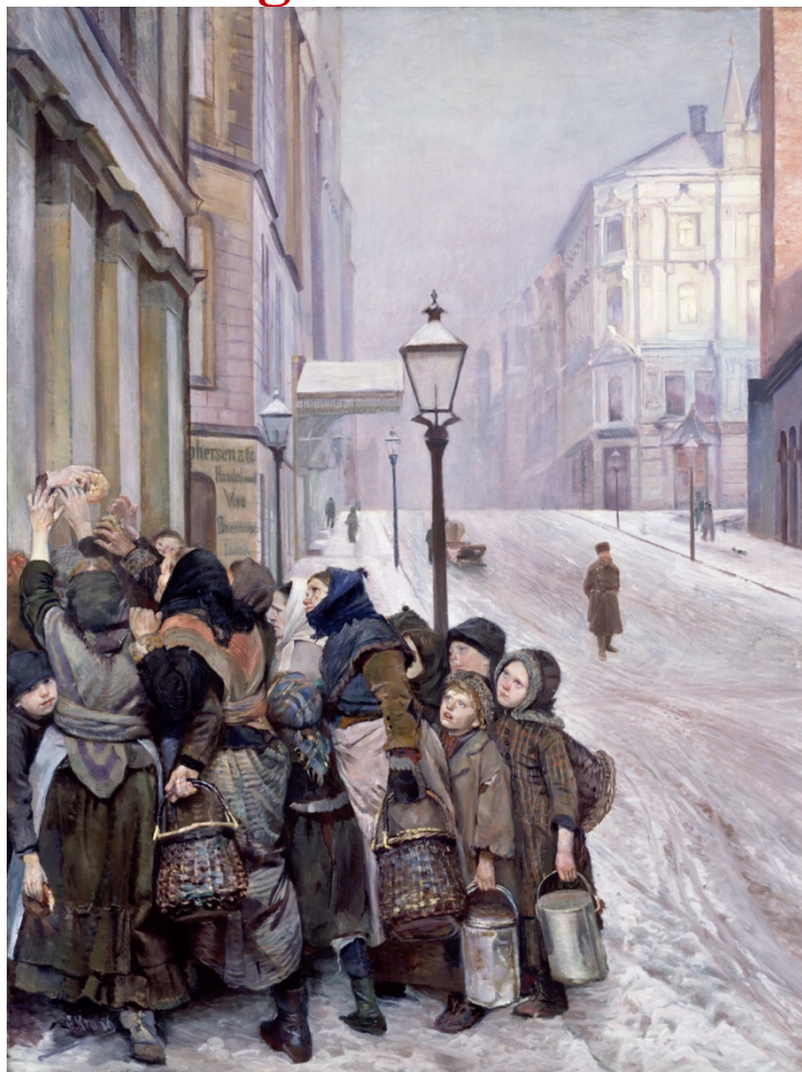
Christian Krohg «Kampen for tilværelsen» 1888